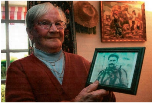
Extefana aitaren argazkia eskuan.

ikusten duzu, non-nabi izanik ere. Maite duzun lagun bat ez da hiltzen baizik eta desagertzen.