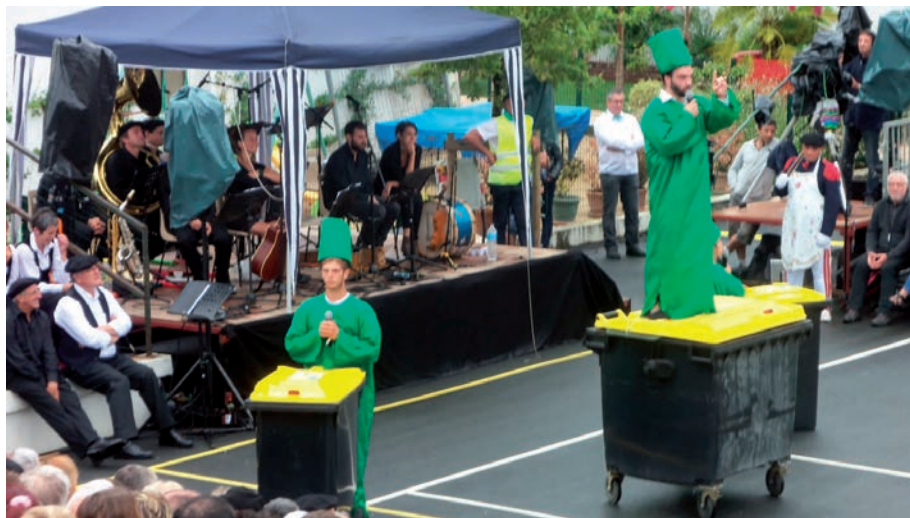
Zabor birziklapenaren inguruko zirtzilkeriak.