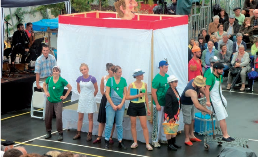
Hiritarrak beien bizimodua defenditzen