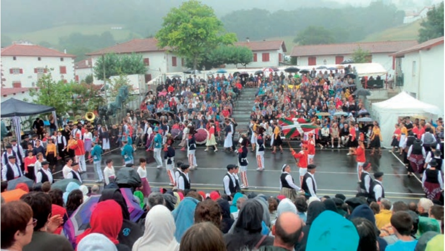
Plazan sartze-itzulia egiten