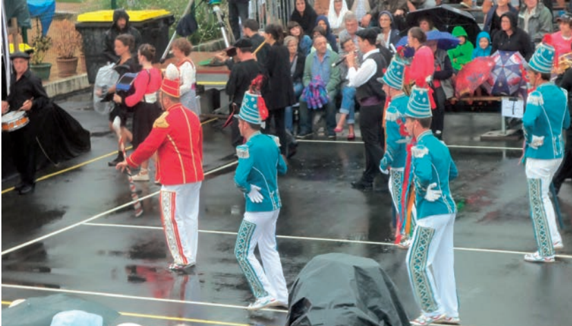
Makilaria eta oilarrak plazara sartzen.

rrak... eta bukaeran, zirtzilak eta bertsolariak. Osora ehun eta hogeita hamar lagun inguru.