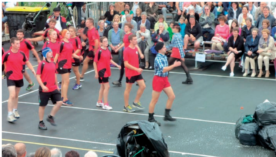
Errugbilariak plazara sartzen.