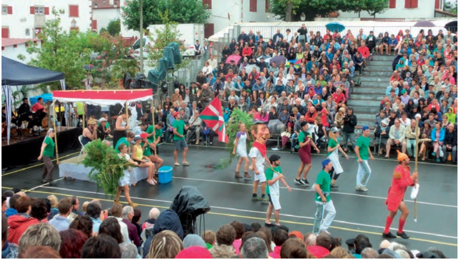
Zirtzilak bazterrak nabasten