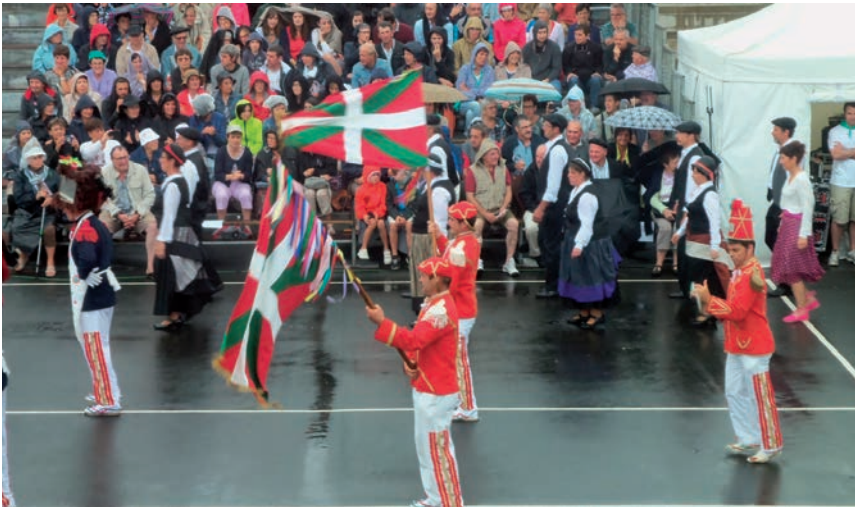
Zapurrak, banderariak eta herritarrak plazara sartzen