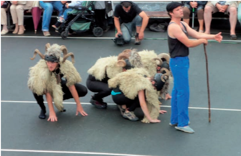
Baigurako artzaina eta bere artaldea

Hortik aitzina antzekizuna korapilatzen joan zen, eta era guztietako pertsonaiak eta agerpenak azaldu: traktore bat, mendizale horietako baten barnea jan zuten saiak, torero edo zezenketari bat txaranga baten doinuaz mugitzen zena,.... Zirtzilkeriatan aritu ziren laborarien mundua eta hiritarrena aitzinez aitzin ezarriz.