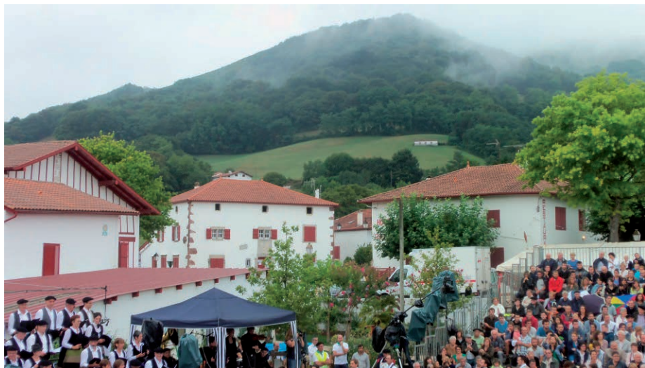
Urtsua mendia laino pean