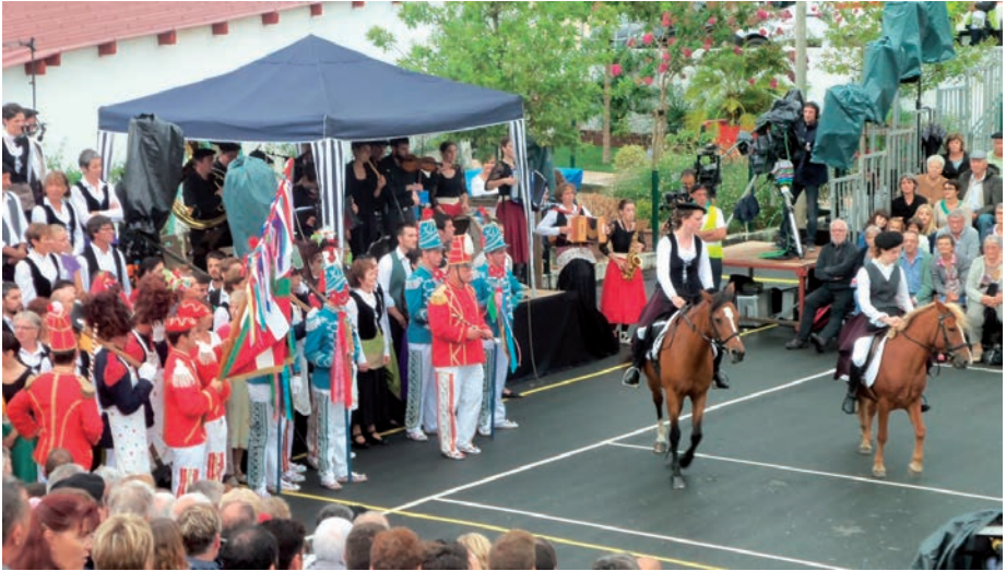
Zaldizkoak amaierako itzuliri basiera emanez