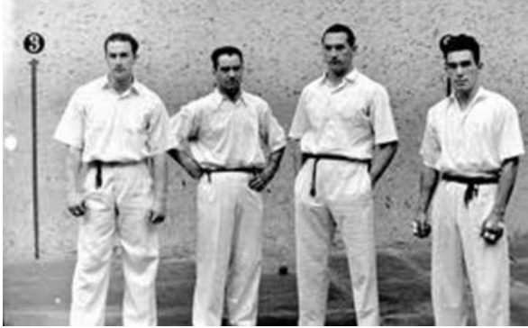
Pilotariak partida hasi aurretik

latzen joan zen, eta gaur ohikoak ditugun joko modalitateak sortu eta zabaldu ziren.