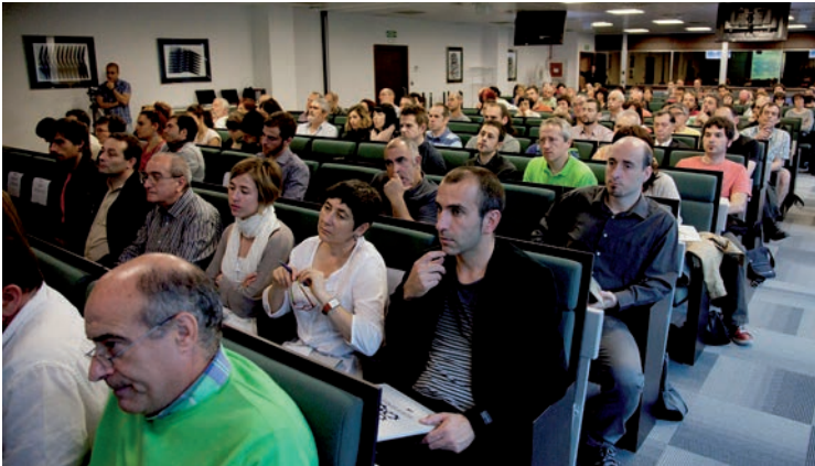
2013ko ekainaren 14an antolatu zuen Kontseiluak Arrasaten lan-mundua euskalduntzeko konferentzia

2013ko ekainaren 13an Euskararen Gizarte Erakundeek KONTSEILUAK lan mundua euskalduntzeko konferentzia antolatu zuen Arrasateko Garaia berrikuntza-zentroan. Konferentzian lan eremuaren euskalduntzean zutabe diren lau eremuetako ordezkariak izan genituen, hain zuzen ere, instituzioak, enpresak, kontsumitzaileak eta sindikatuak eta bertan iritziak jasotzeko aukera izan genuen.