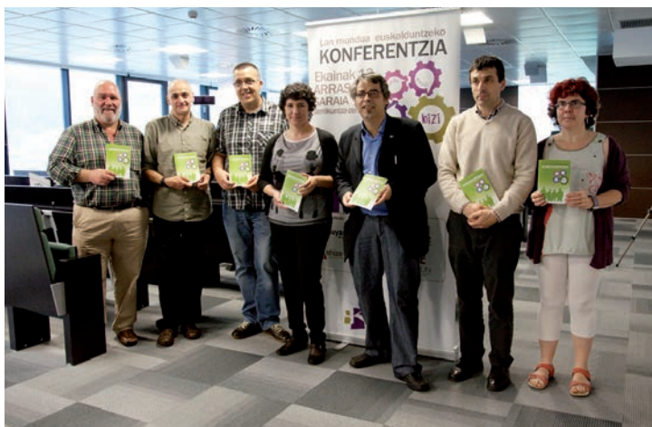
KONSEILUko aholkularitza sektoreko bazkideetako ordezkariak "Lan mundua euskalduntzeko adierzapena" aurkeztu zuten 2013ko ekainean

Ondotik, 2011ko Euskararen Gizarte Erakundearen Kontseiluaren kudeaketa-planeko helburu estrategikoen artean jaso zen bazkideen sektorekako lanketa eta aktibazioa bilatzea . Bide horretan, lehenik ere aholkularitzekin 1 abiatutako lanari jarraiki, sektore honetan biltzen ziren erakundearen lan-taldea dinamizatzeko ardura hartu zuen bere gain.