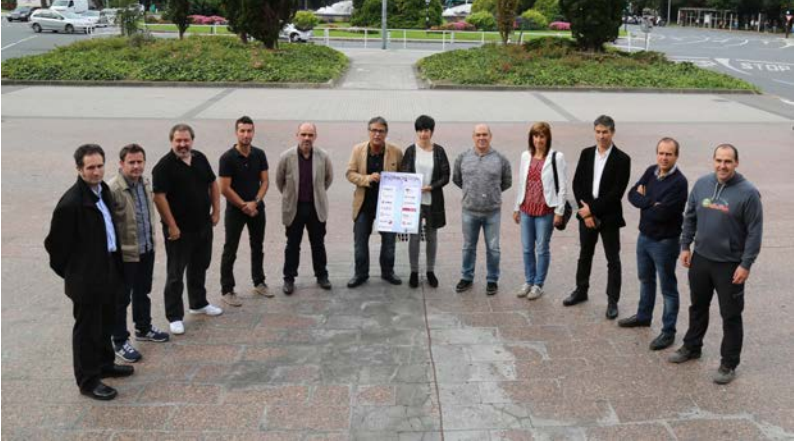
Euskaragileak batzordeko eta Kontseiluko ordezkariak

Zalantzarik ez, urrats ausartu egin dutela enpresa horiek guztiek, eta lan mundua euskalduntzeari begira eredugarria izango dela. Halere, ez da nahikoa. Kontseiluan argi dugu beste zutabeak astintzen ere hasi behar dugula: langileak, sindikatuak, enpresariak, kontsumitzaileak, administrazioak... Pozik gaude lehen zutabea mugitzen hasi bezain pronto, bidaide berriak aurkitu ditugulako lan munduaren euskalduntzean, eta horrexegatik, Euskaragileak batzordeari gure laguntza guztia eskainiko diogu. Dena den, espero dezagun, berandu baino lehen, aipatutako beste eremu horietan ere horrelako ekimenak abian jartzea. Finean, berriki utzi gaituen OSKORRI taldearen eta horrenbeste aldiz kantatu dugun abestia betetzerik besterik ez dugu nahi: Euskal Herrian euskaraz nahi dugu hitz eta jolas, lan eta bizi euskaraz eta horretara goaz.