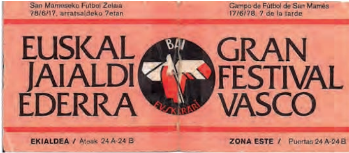
“Bai Euskarari” jaialdiko sarrera (San Mames, 1978-06-17)

genduan. Baina “Bai Euskarari” liga oso liga luzea danez, ondinokarren ez dago txapeldunik. Airean dago dana.