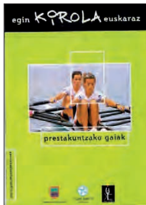
Euskereka eta kirola buztarturik