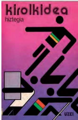
Kirolkidea hiztegia 1982. urtean argitaratu zan.

Omenaldia bideratzea zela-eta, lehenengo aldiz, lankideekin bildu nintzanean, kirol-hiztegi bat egitearen ideia atera zen; eta omenaldikoan bilduko zen dirua horretarako eskaintzeari inolako duda-mударik gabe eman nion nire baietza. Egia, Euskal Herrian bada behar gehiagorik, milaka seguru aski: baina ni kirol-mundutik natorrenez, oso egoki iruditu zitzaidan kirolari aportazio hau egitea.