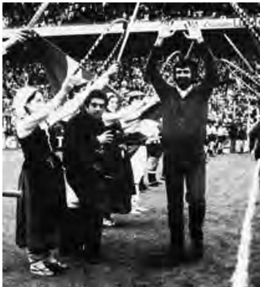
Jose Angel Iribar bere omenaldian (San Mames, 1980-05-31)

Omenaldia arrakastatsua izan zan, eta zelaiko partiduan Errealak nagusitu zan arren, “Bai Euskarari” liga luzean, benetakoa irabazlea euskerea izan zan. Iribarrek zelaian bertan azpimarratu eban ideia hori, “Euskarak irabazi du” esan eban-eta.