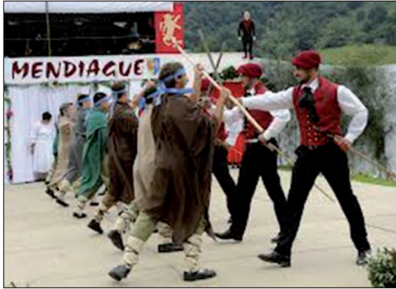
Güdüka kolono europarren eta maputxeen artean.