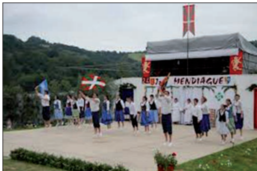
Agur dantza zoragarria.

nak eta Aintzina pika. Harmailetan ziren sohütarrak oholtzara igo ziren eta airoxki dantzatzeari lotu zitzaizkion. Ongi erakutsi zuten Sohütak dantzari onak dituela, hurrengo urteko pastoralearan ere aukera ezin hobea ukanen dute beraien trebezia erakusteko.