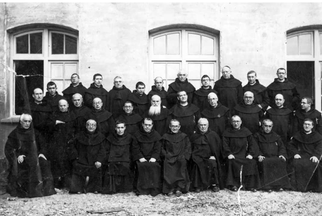
Zornotzako Karmeldarren ikastetxe aurrean (1933ko apirila).