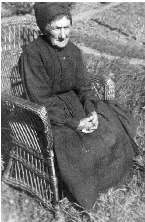
A. Martinen ama.

1898ko irailaren 11n egin eban Profesa Nagusia, Jaunari behin betiko bere burua sagaraturik. 1903ko irailaren 6an har-