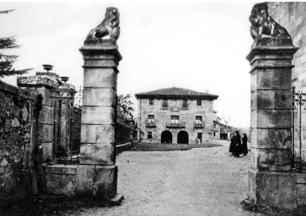
Larreako ikastetxe zaharra eta leboien eskulturak sarreran.

sartzen dira, esaterako, misioak, gogo-jardunak, hirurrenak... Eta holan kopuruak gora eta gora egiten dau. Bere idazki horretan esaten dauanez, kontuak eginda, 55 urteren buruan 19.000 sermoi inguru izango dira A. Martinek predikatu zituanak.