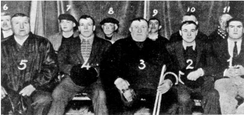
Lehenengo Bertsolari Txapelketa Nagusia (1935-01-20)