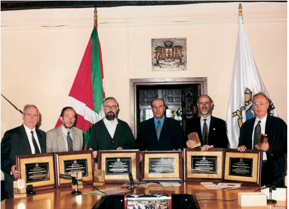
Aramaio, 1999. Aramaioko seme kuttuna izendatu zuten egunean.