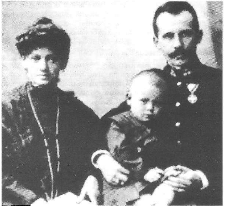
Karol bere gurasoekin.

Bizitzaren defentsan, "Evangelium vitae" argitaratuko dau. Zirrargarria bertan biziaren aldeko otoitza. Ekumenismoaren arazoa "Ut unum sint" idaztian sakonduko dau. Bera izango da leenengo Aita Santua judutarren sinagoga baten sartuko dana. Baita musulmanen mezkita baten be. Eta bere azkenengo entziklika "Ecclesia de Eucharistia" izango da. Eukaristiari eskeiñitako esker onezko poema eder bat dirudi. Or agertzen da Joan Pauloren Eukaristi esperientziaren barnekotasuna.