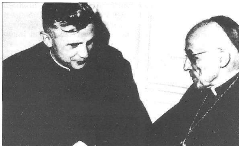
Ratzinger apaiz gaztea Josef Frings kardinalarekin kontzilioko lanetan.

Nazioarteko Batzorde Teologikoaren buru izandakua izan zen 1981eko azaroaren 25ean.