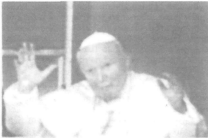
Aita Santua igandeko agerraldian

Berehala zabaldu zen albistea mundu guztira. Erietxeko zuzendaritzak, bertan bildutako ehundaka kazetarietarako pre-