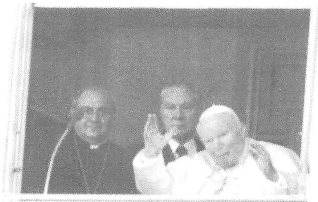
Aita Santua, Leonardo Sandri gotzaina –ezkerrean- eta bere laguntzaile bat, igandeko agerraldian

Egonaldi honetan bisita kopuru murriztak izan zituen Joan Paulo II.ak. Baina aipagarriena, mundu guztian ospatu ziren