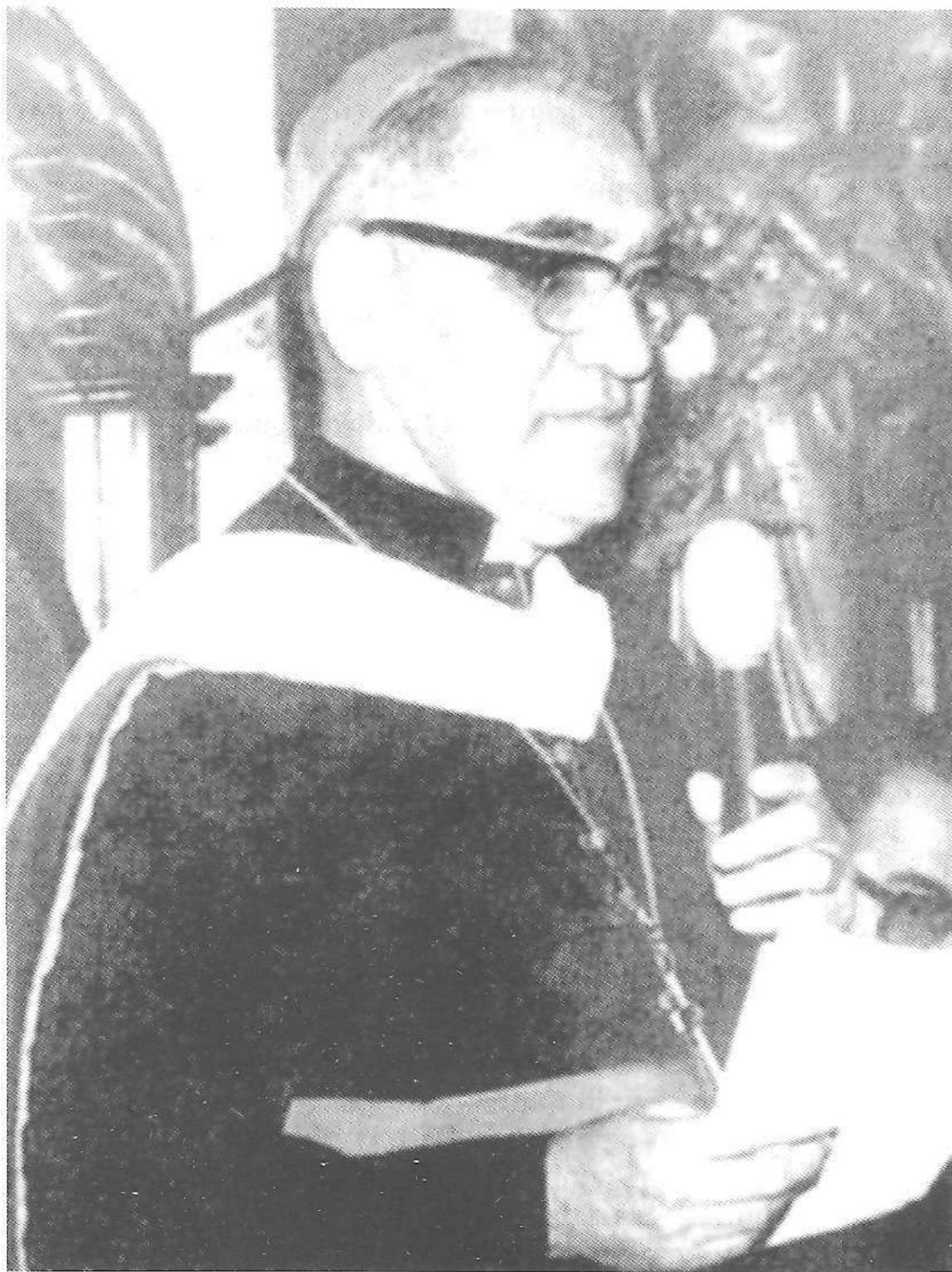
Doktore Honoris causa izendapena, Georgetowneko Unibertsitatean, AEB. 1978. otsaila