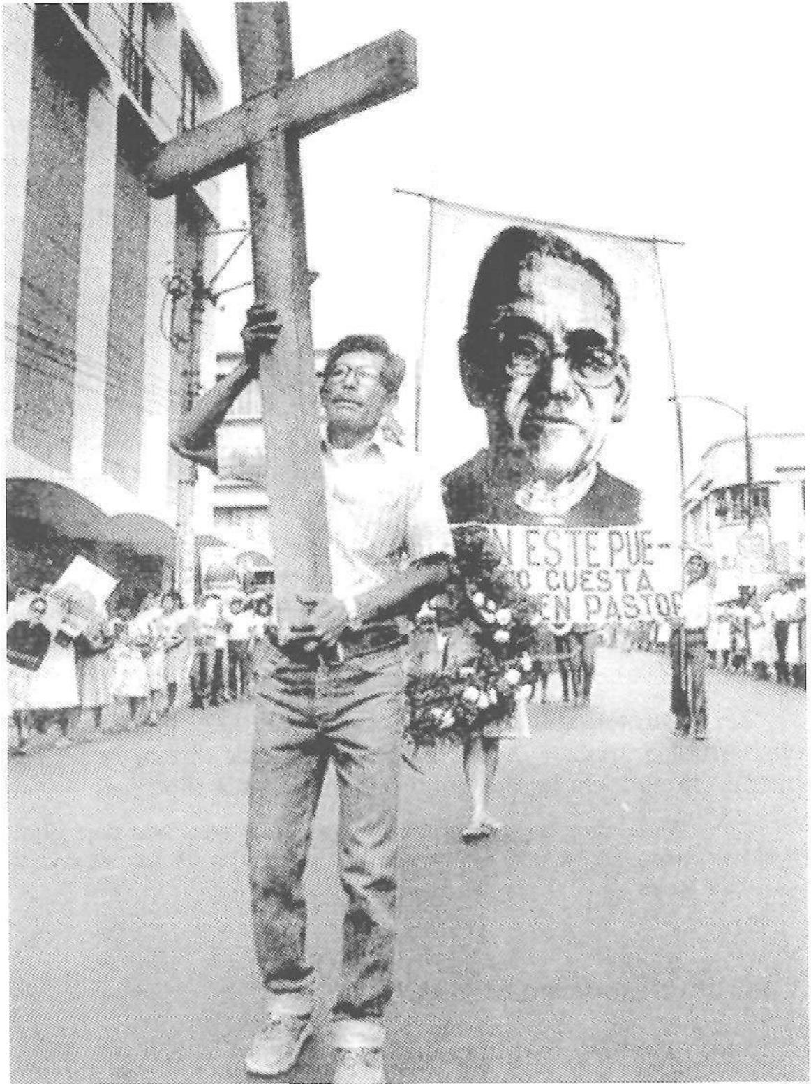
Hilketaren bostgarren urteurrena. 1985.