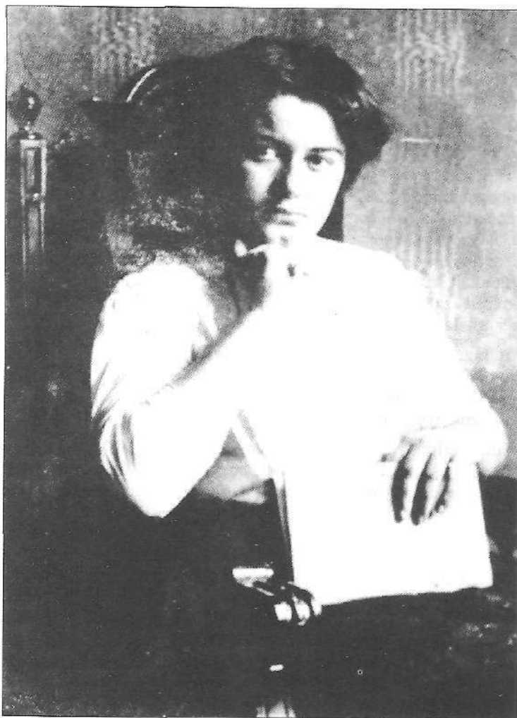
E. Stein bere krisirik handiengan, 1913-1914ko neguan: Adolf Reinach-ek lagundu zion.