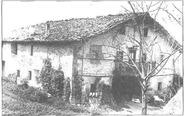
Imanol Enbeitaren baserria.