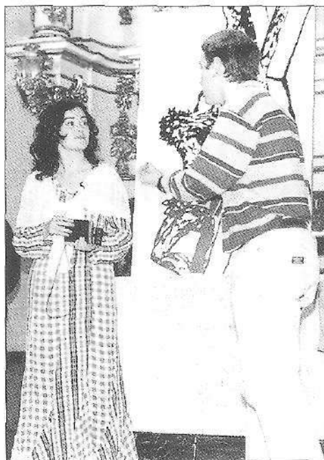
Antzerkiko eszena bat.

Aurtengo kurtsoan, Teresaren bizitza eta mezua ezagutzeko lan galanta egin izan dogu Larrean. Ez da egongo Larreako katekista bat bera be Teresaren "Arima baten Historia" irakurri ez dauanik. Baita berari buruzko beste liburu- ren bat be. "Creer amando" deritxona, esaterako.