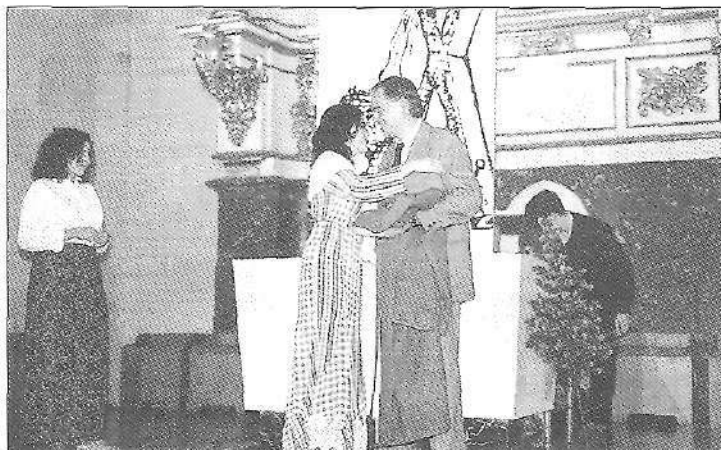
Antzerkiko eszena bat.

ra. Ta orain Aita Santua berbera Lisieuxera doa, Teresaren aurrean otoizka. Gauzak zelan aldatzen diran!