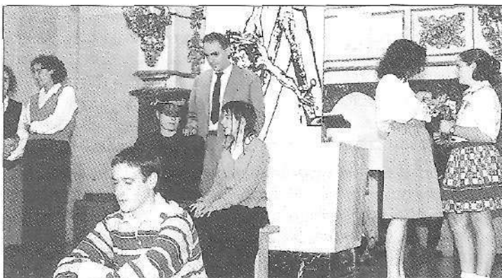
Antzerkiko eszena bat.

Ezin daikegu ahaztu Larrean bizi garanok, gure Katekesiaren zaindari be badogula Teresa. Gerra Zibil zitalaren ondoren sortu zan Larre-ako katekesia. Helburu nagusiena, kristau bizitzan, in-guruko ume ta gazteak hezitzea izango da fundatzaileen asmoa. Baita arbuaiaturik egoan euskerea zaintzea be. Helburu bi honeek ondo bete izan ditu Larre-ako katekesiak. Eta betetzen dihardu.