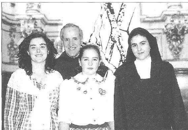
Teresarena egin eben hiru antzeslariak, eta antzerkiaren eragilea.

Eta azaroaren 2an, urrezko ezteguak gomutatuz, omenaldi bero bat eskeini geuntsen Katekesiaren sortzaileei. Eleizea gai-