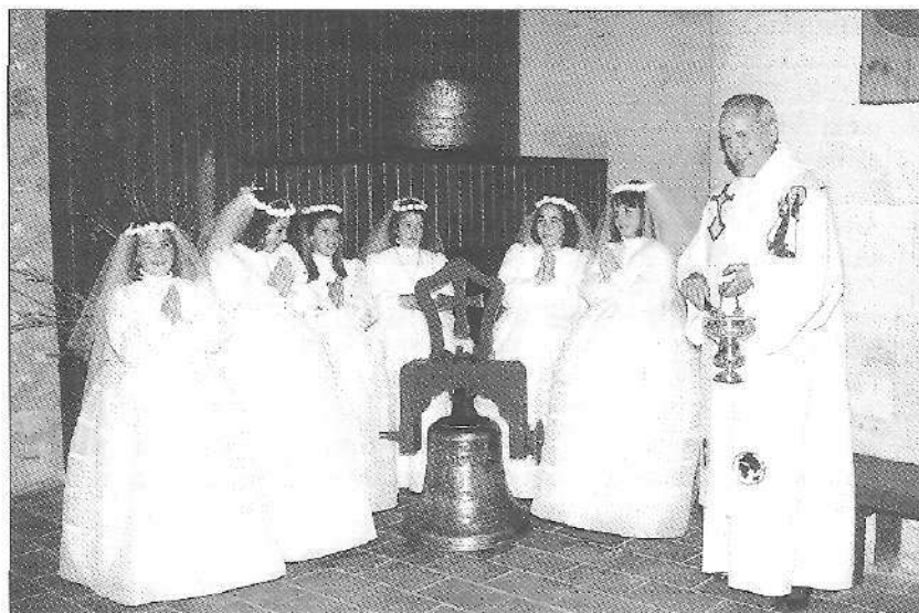
Teresaren izeneko kanpai barria bedeinkatzen.

tan, presbiterioko anboia eta ohola aldatu, belaunikatzeko gabeko banku barriak jarri. Eta beste mila gauza txiki be bai.