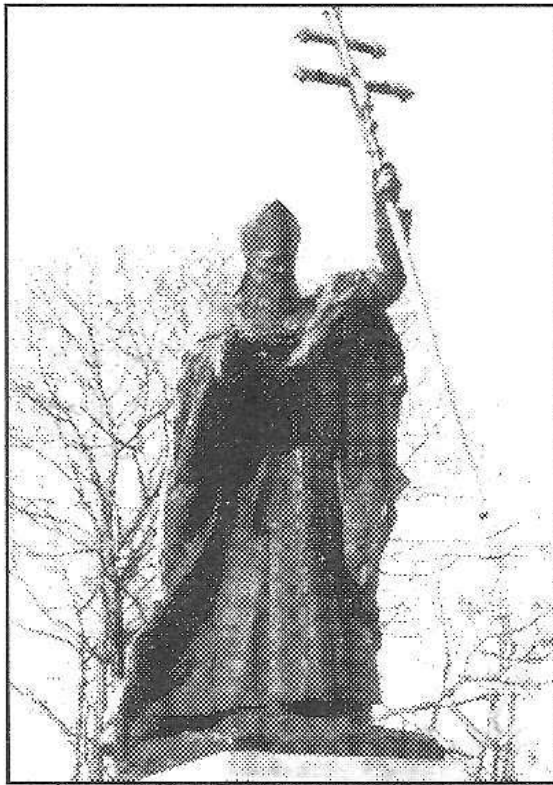
Lavigerieren oroigarria Baionan

Ara eta ona asiko da bere misiolariak bialtzen. Berealaxe beste bildurgarrizko arazoan artean, asiko da Lavigerie