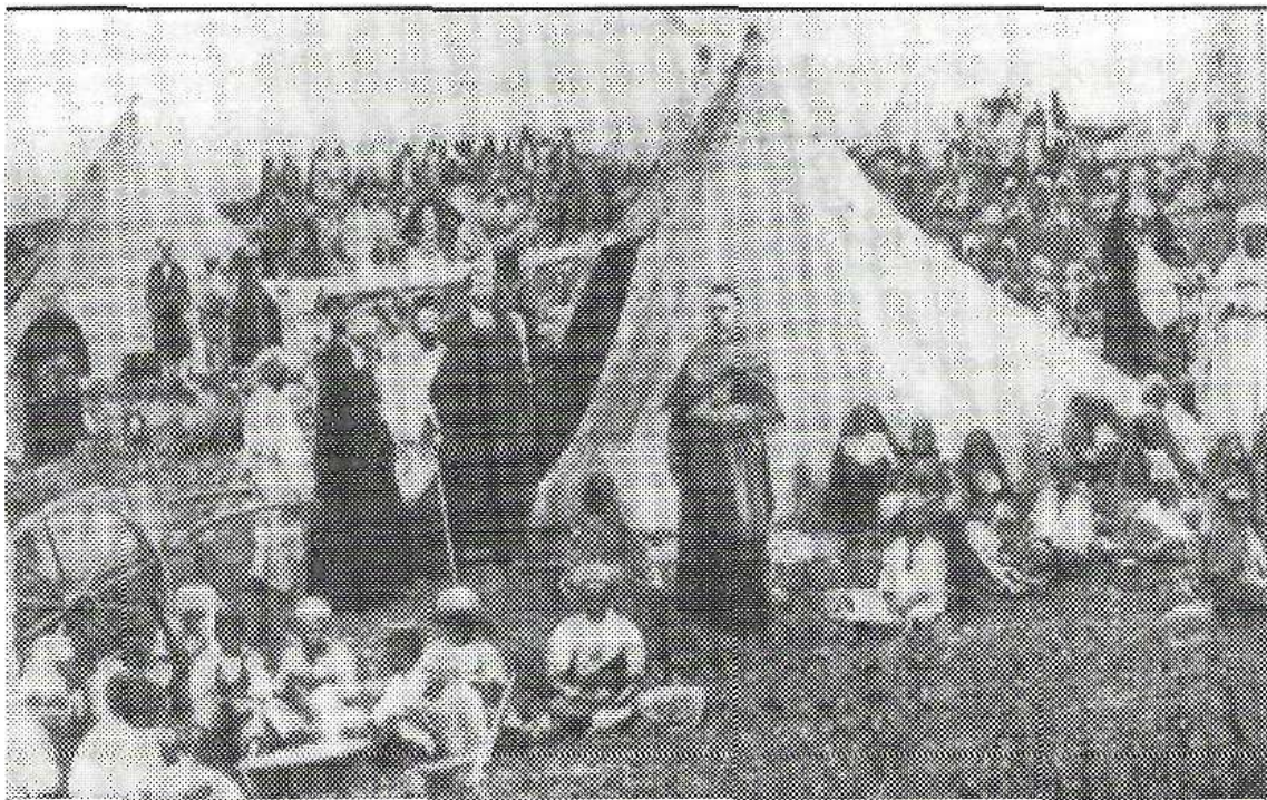
Izurri eta goseteen Argelen (1867) laguntza ekintzan antolatzen

Olan erneko da barnean daroan misiolari bokazioa. Badauko ze ikusia beste euskaldun batek be. Ravignan erlijiosua da Lavigerieren konfesorea eta zuzendaria. Baionatarra au be. Ekin ta ekin dabil bultzatzen misio lanetara. Ekialdeko Eskolen zuzendaritzan beste mundu barri bat ezagutzeko aukeran dago: musulman mundua, Turkia, Ejipto, Palestina, Siria, Libano. Erri oneetan aleginduko da eskolen bidez kristau zibilizazioa indartzen. Zelako oztopoak ezagutuko dabezan gauzak aurrera eroateko! Alde batetik dirurik eza. Orretarako zenbat itzaldi Frantzian zear: Paristik Marseillaraino, Baionatik Lyoneraino. Bestetik maometarren erasoaldiak eta basakeriak. Berrogeitamar milla baino kristau geiago garbituko dabez Libanon bertan