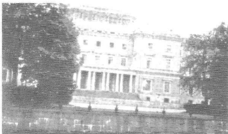
San Petersburgo Akademi militar onetan ikasle ta irakasle izan zan Rafael Kalinowski (1853-1859)

ikasketak egiteko, Rusiako agintarientzat lan egiteko izan ezik eta Rusiako arma-gizonen Akademian artu dabe arkitektura ikasi ta Zubi eta Bidegintzako gaiak ikasteko. Emen jarraituko dau 1853tik 1858ra arte, eta eskola-agiri ederrak atera ditu, kapitan mailla lortzeraiño, akademian bertan irakasle bere ipiñi dabe, baiña andik laster, Bidegintzerako maisu danez, 1858tik 1860-ra Odessa-Kiew Kursk-erako trenbidearen nondik norakoa aztertzeraz bialduko dabe.