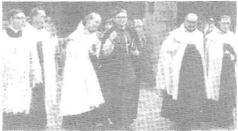
Krakovia: Karl Wojtyła Goizaina (gaur Juan Pablo II, Erromako Aita Santua) Karmeldarren elizara eltzen; bertan bedeinkatuko dau Aita Kalinowski parte artu izan eban askatasun gudaren (1863-1963) arri-oroigarria.

Alderdi au ez da gure fraidearen santutasuna gitxien erakusten ebana. Santu zalako ospe onek lagundu eutsan len eta gero. Baña berari ez egoan lotsarik geiago emoten eutsanik santu ospe ori baño. Pekatari andientzat eukan bere burua. Alan esaten eutsen autortegian pekatariarik andienari.