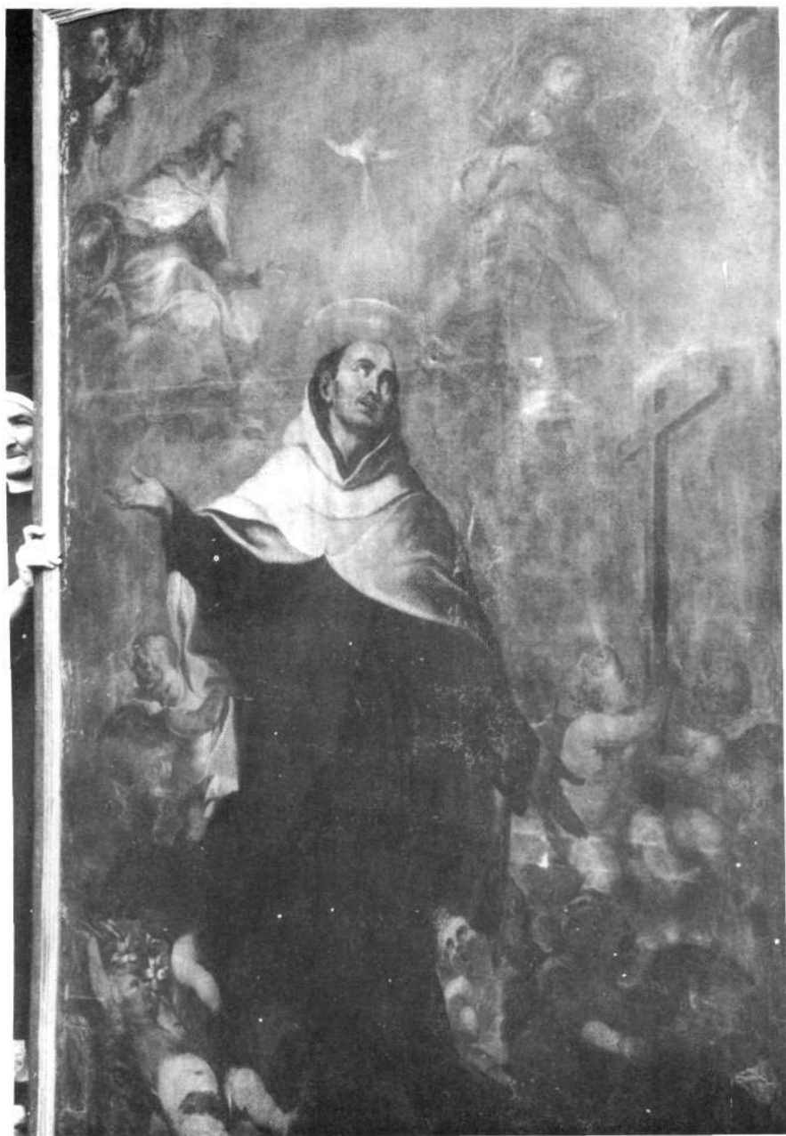
Tutera, Klaratarren monastegian (Egilea: Vicente Berdusan).