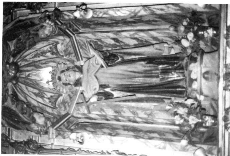
Markina, Aita Karmeldarren elizan.