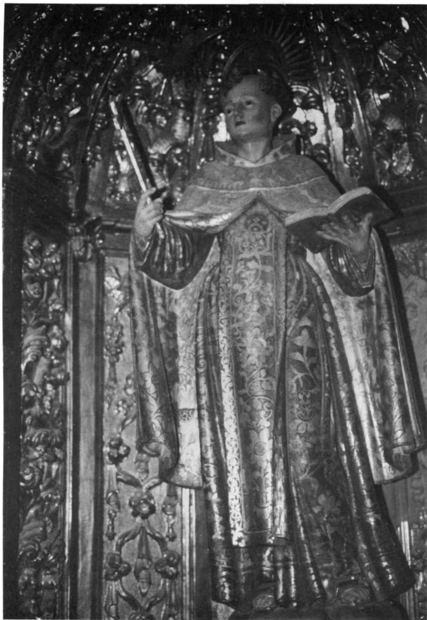
Korella (Egilea: Fray Juan de los Santos [atribuigarri]).