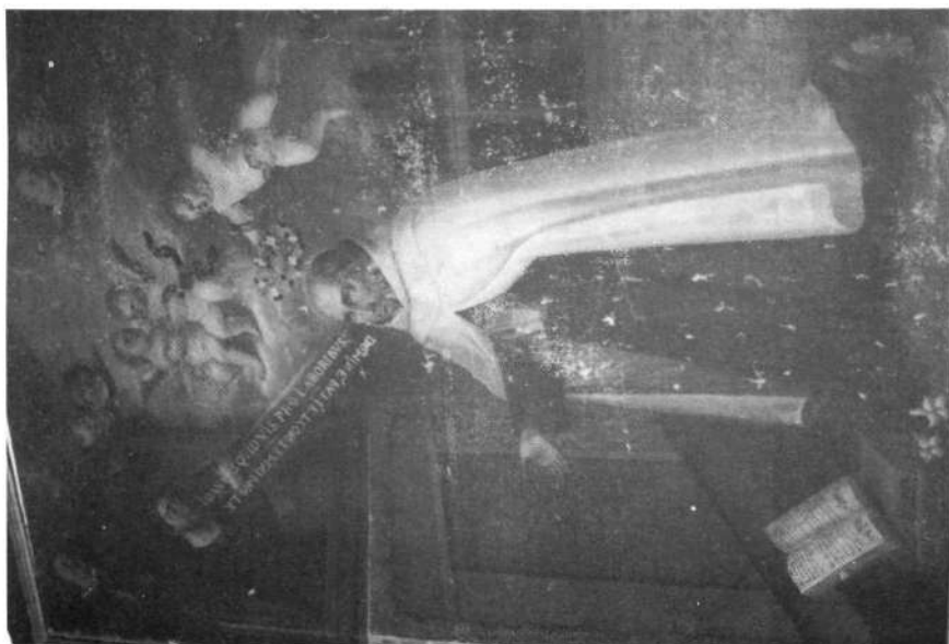
Iruña, Karmeldar lekumeixean.