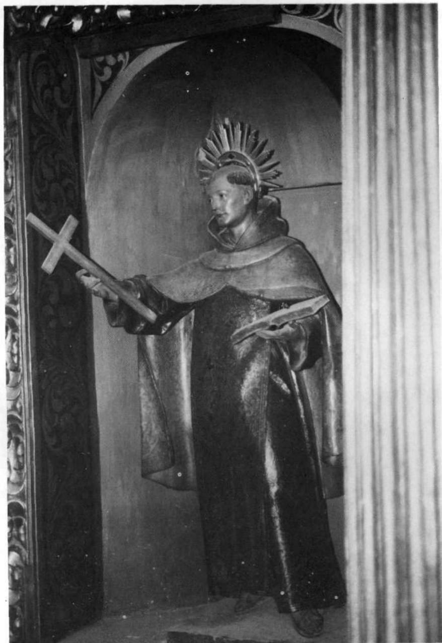
Iruña, Aita Karmeldarren elizan.