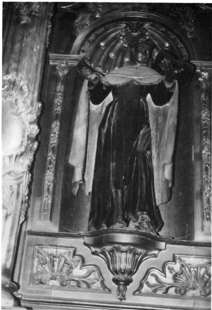
Korella, San Miguel elizan.