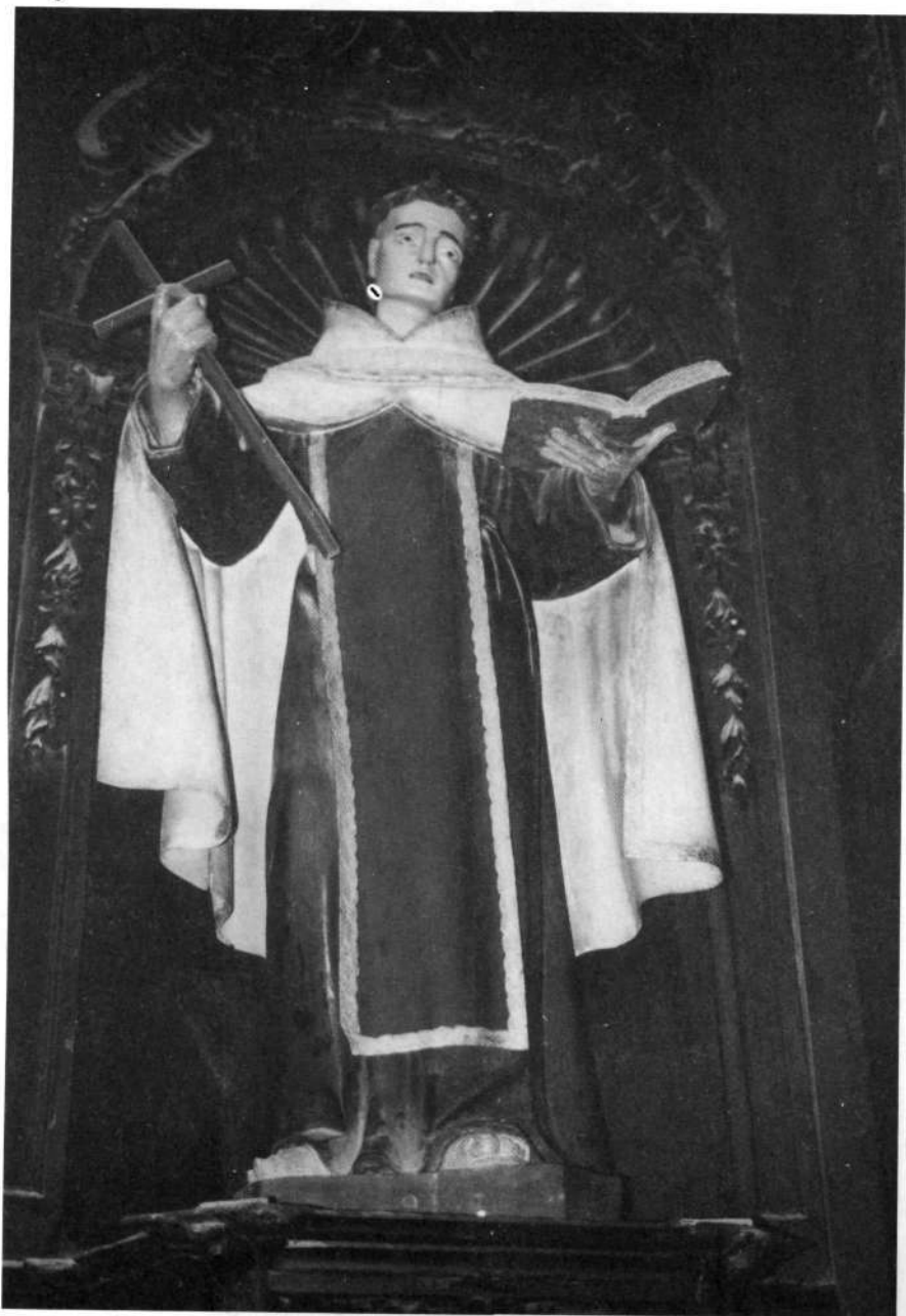
Villafranca, Aita Karmeldarren elizan.