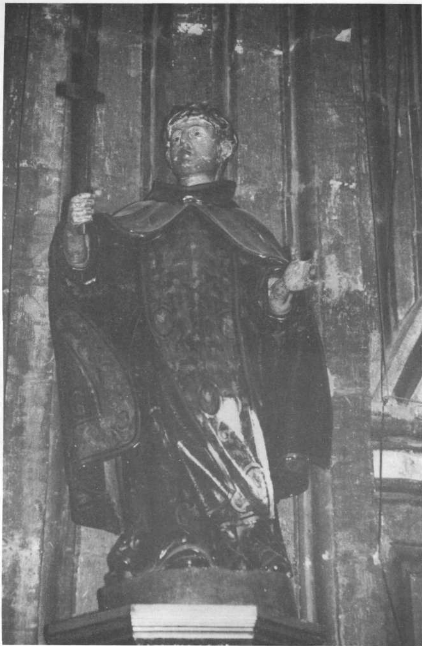
Los Arcos (Nafarroa), elizan.