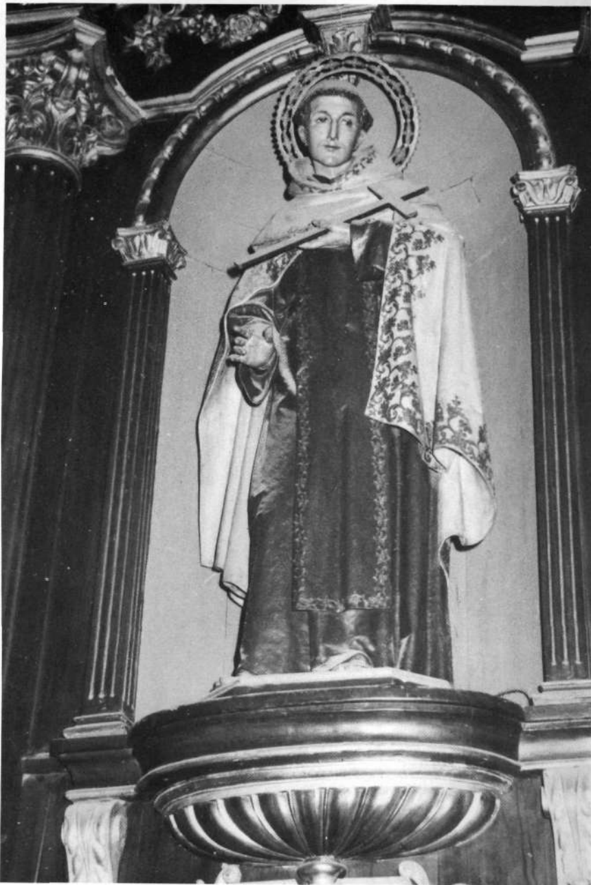
Gasteiz, Aita Karmeldarren elizan (Egilea: F. Font).