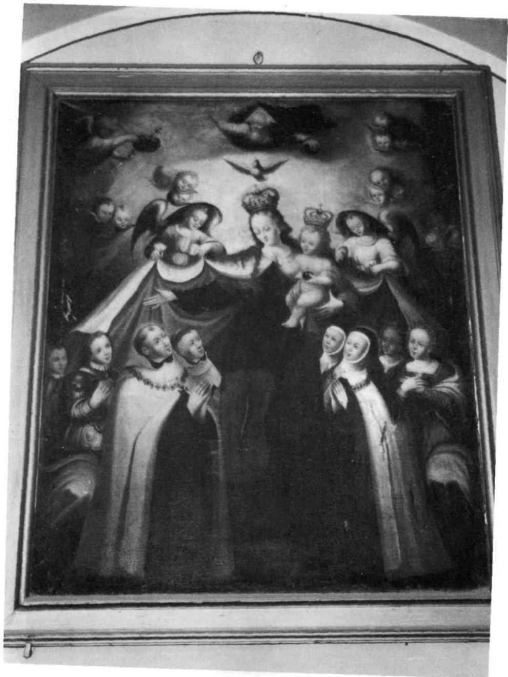
Villafranca (Nafarroa), Karmeldarren elizan.