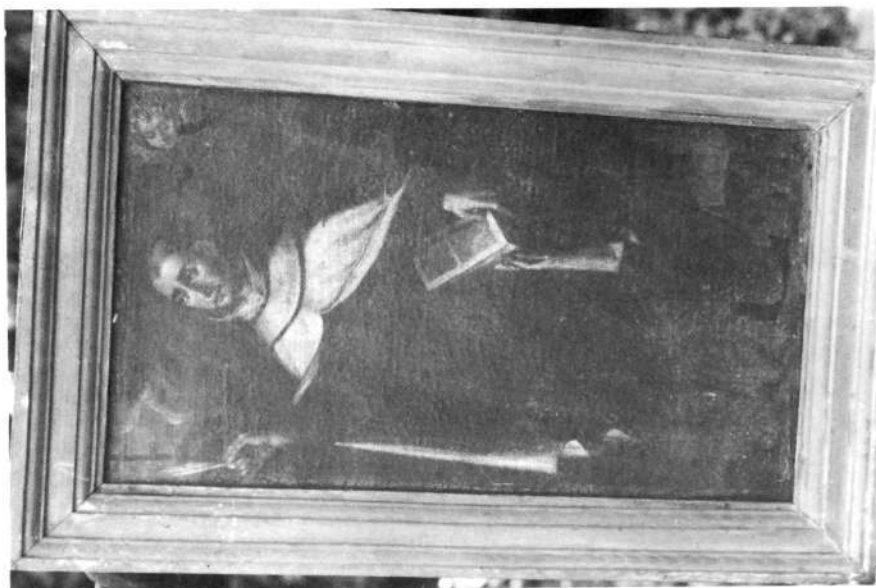
Lazkao, Benediktinarren monasterioan.