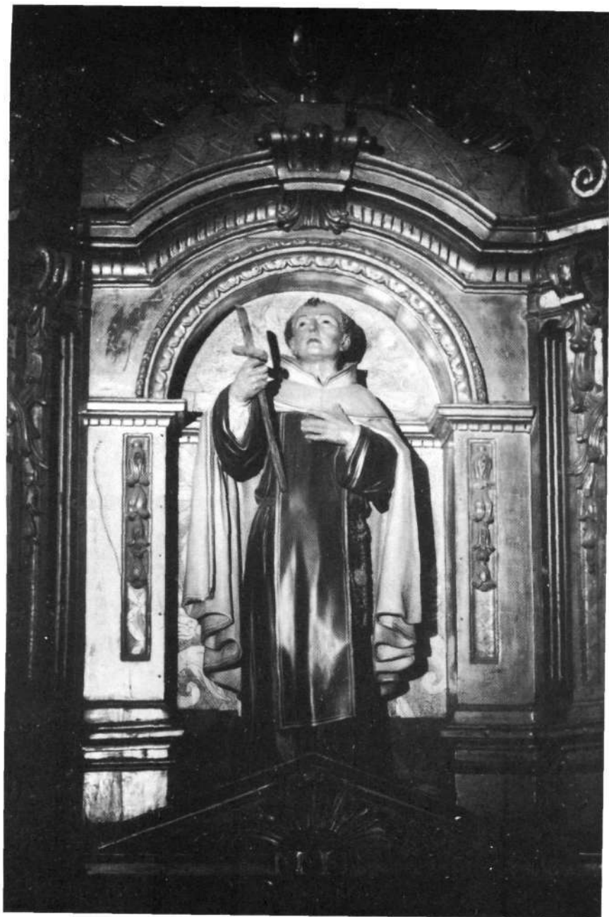
Larrea-Zornotza, Aita Karmeldarren elizan.