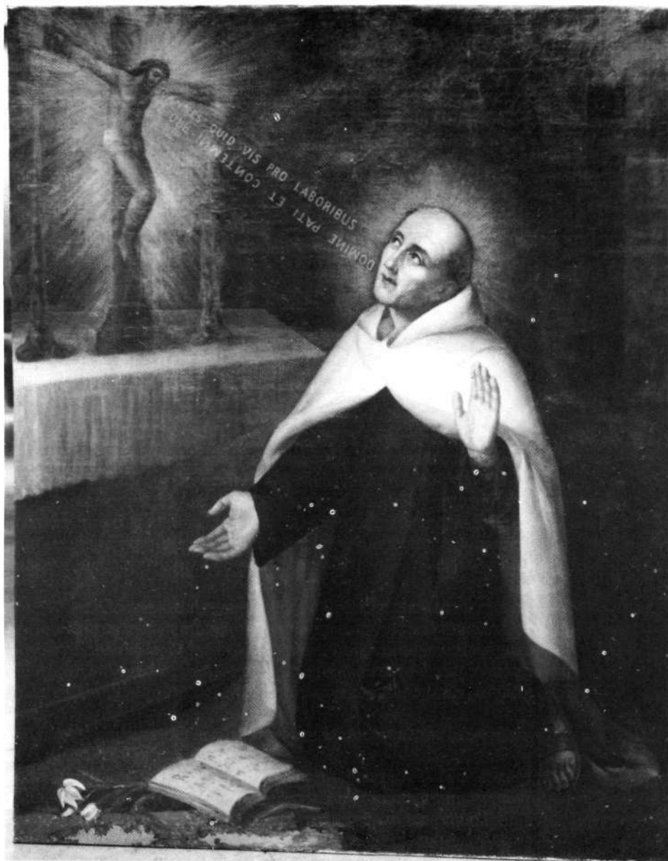
Murgia (Araba), Karmeldarren monastegian (Egilea: Manuel Losada).