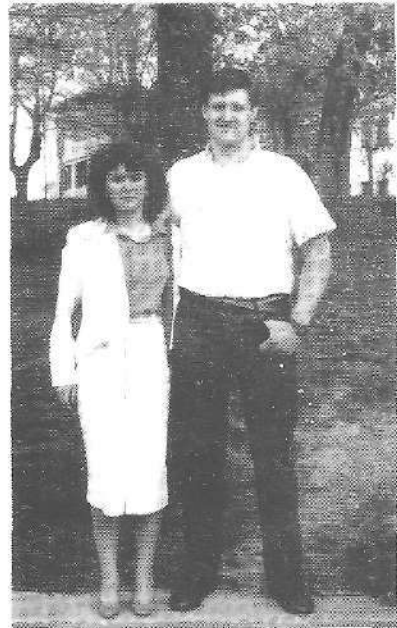
Sakoneta bere lengusiñagaz

S.- Ez da, nire ustez, langabezia. Ori be bai, baina ez da larriena. Kontsumoaren eta propagandaren katepean or dabil gaztedia nora-ezean batetik bestera, erre kara botatako egur zatia urak daroan bezela. Ez dau inon gozamenik aurkitzen eta naskauta triste bizi da. Nortasunik eza, barruko gozamen egarri ori zelan asetu ezina, orixe da niretzat gaurko gaztediaren arazo larriena.