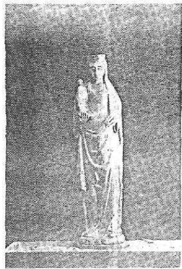
Baionako «Musée Basque»-ko Andra Mari, XII. mend.

Luzeegi joko genuke lekuan lekuko Andre Mari guztien euskal-kantak aipatu bear bagenitu. Aipatuak aski bitez euskal Andre Mariaren KANTARI IZAN DALA gaur arte eta kantari jarraitzeko bidean dala argiturik usteko. Iturri onek ez du agortzeko itxurarik gaurkoz. Eta alde bateko kantuak beste aldeetara aldatzen dirala ikusten da Joan dan gizalditik ona Lapurdi aldeko kantu asko aldatu dira Bidasoaz onuzko aldeetara, eta