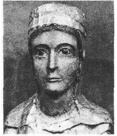
Uxueko Andra Mari, XI. mend.

Literaturan bezala, Iparraldetarrak aurrea artu zieten Bidasoaz onuzko euskaldunci. Onek ez du esan nai emen ez zala elizetan abesten, baiña ez zegoela an bezelako kanta-sortarik. Emengoak berandua-