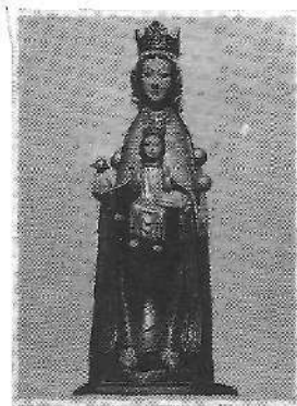
Estibalizko Andra Mari, XII. mend.