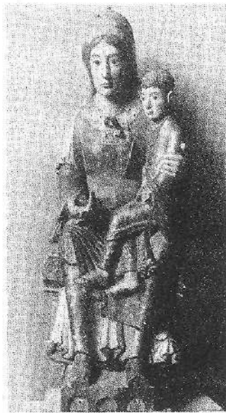
Naxerako Andra Mari, (XI-) XII. mende.