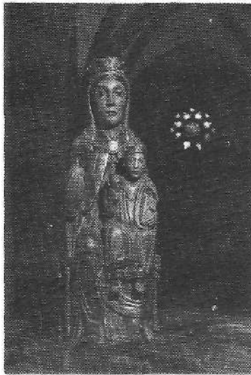
Lekitioko Andra Mari, XII. mend.

zerorren Semea, zerutik zeru jatziriko gure mesedea?