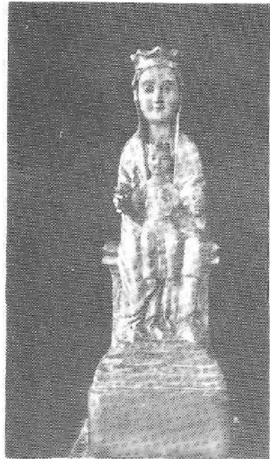
Itziarko Andra Mari, XII-XIII mend