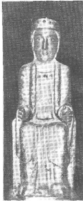
Juncal-eko Andra Mari, XII. mend.

duma oparoagoak datoz. Aita Donostiak prestatuta, Jaungoiko-Zale bazkunak eleiz-kantazko sorta politak aterako ditu eta Jaungoiko-Zale bazkunaren irarkelan agertuko da 1925n eskuan errez erabiltzeko bilduma ederrena, Eleiz-Abestiak, Andre Maria gorestekoa kanta uzta ugaria dakarrela, orainarteko ugariena.