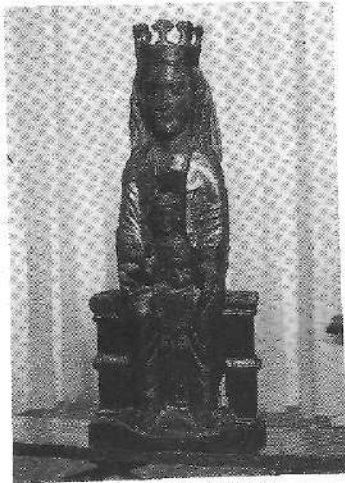
Arteko Andra Mari, XI-XII. mend.

Maiatzeko Loreen jaiarak ere Andre Mari kantak, batez ere, sarrerako Goazen goazen guztiok , edo Guzti guztiok alkar arturik , beste batzuen artean. Maiatzeko loreen oitura au liburutan agertzen Lapurditarrak izan genituen aurrelari. Joan daneko gizaldi orretan ainbat liburu eman ziran argi-