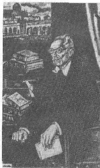
José Gutiérrez Solana (1886-1945): Begikera urrun samarrean, uleak aidean nahaspillaturik dituan Unamuno, Solanarena.

Unamunok asko maite ebazan arte plastikoak, batez ere pintorea oso gogoko jakon, naiz eta margokuntzarako trebeta-