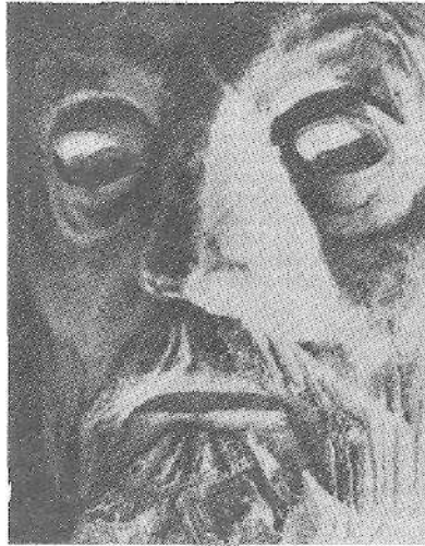
Aurpegi ameslari ta zerbait enigmatikoa dauan Unamuno VICTORIO MACHO, irudigilearena.

sunik ez izan, baiña, halan ere, zerbait praktikatu ebala adierazten dau: «Umetatik dibujotik artean ari nintzan, diño, eta geroago margokuntzan; baiña, azkenengo hau laga badot, margorako habilla ez nintzalako izan da. Marrea ta argillunak bai, baiña margoa ez; hau zailla egiten jat».