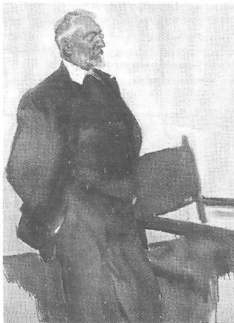
Joaquín Sorolla, (1863-1923): Bilboko Museoan dagoan, amaitu gabeko Unamunoren erretratuak urritasuna kolorean, ta pintura pastea gitxi hedatuta erakusten deusku

ikuslearengandik urrun samar agerterazten da.