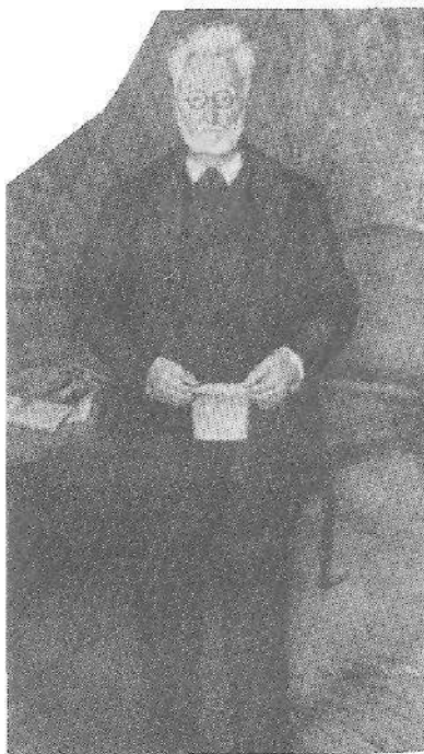
Juan de Echevarria, (1875-1931): Unamuno barrukoia ta biguna, pintatzaile honek agerterazten dauana.