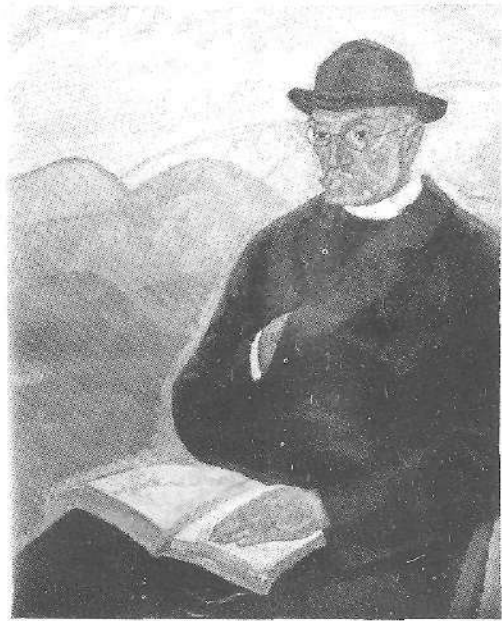
Daniel Vázquez Díaz, (1882-1969): Bilboko Museoak zuhurtasun haundiz jokatu eban erretratu hau bereganatzean, Unamunoren erretratu hobezina askoren ustez.