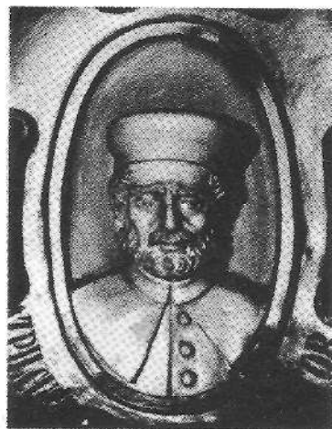
Naparroako Foru Aldundian dagoen irudia

Irakaskintza itxi eta oporturteak etorri jakozanean, bakar-etxe baten sartuta bere idaz-lanak zuzendu eta argitaratzen emon nai zituen urte bi edo iru. Olango lanetan, Salamankan etxe baten ostendurik egin eban urte bete iñora urten barik. Baiña leku gordeago baten billa, Frantziara joatea emon eutsan gogoak. Bidean doala, Naparroako mugetan, anka bat iru lau lekutan ausita, bere jaiotetxera biurtu bearko dau. Olantxe jakin zan erabilli zituen asmoen barri.