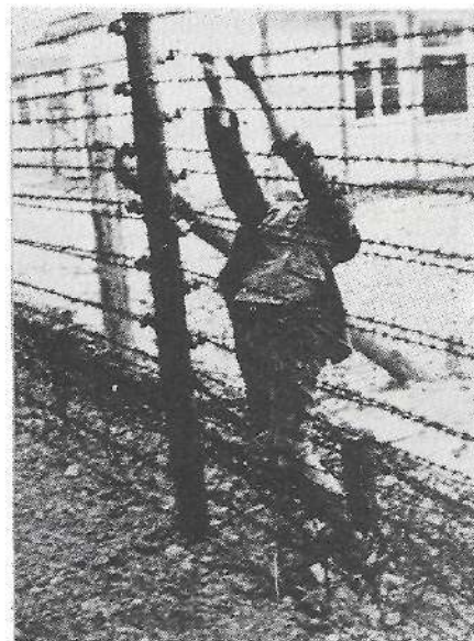
Ziri zorrotzeko esparrauan atxillotu bat.

Andik egun gitxira, apirillaren 26n, Pazko aste barruan, barriro Sheveningen-era, an epaikaritzat dagozanen itaunketa barriari erantzuteko. Oraingoan kontu luzeagoak eskatzen deutsoez: Nimegako Unibertsitate atan zer irakatsi ta egin dauan, eskoletan, eta egunkarietan zer erabilli dauan, eta zergaitik eta zelan ibilli dan judeguak estaltzen eta arein umeak eskoletan artzen. Danari zuzen eta ikara barik erantzun deutsoenean, epaikariak, erruki artu baleutso lez, azkenengo itauna egi-